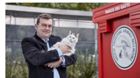
Società Protezione Animali Bellinzona

Le AMB ringraziano i clienti wambo che hanno partecipato alla campagna wambo dei nuovi volti «uno di noi».