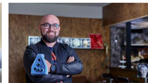
Provoca Azione Sagl, Giubiasco