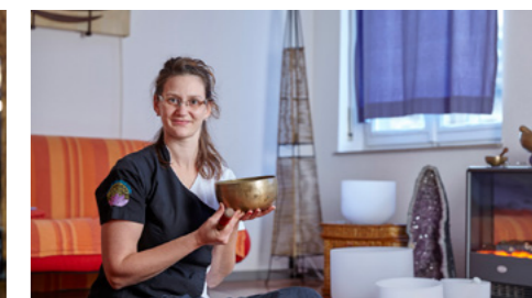
La Luce del Benessere, Bellinzona